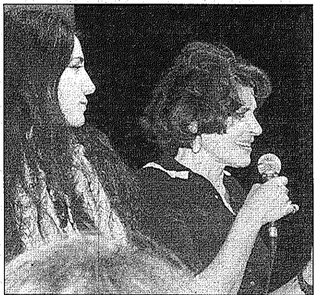
Ronit Elkabetz et Fanny Ardant, deux stars en majesté lors de la soirée d'ouverture du festival.