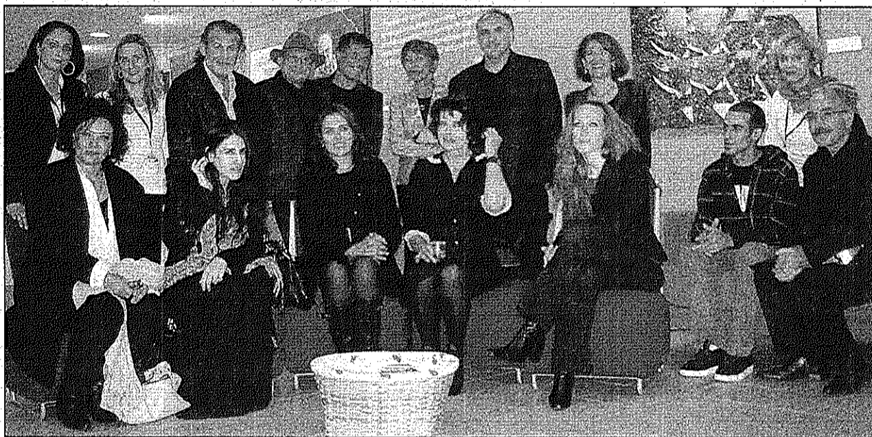
Une rencontre exceptionnelle, en présence des principaux acteurs, réalisateurs et participants de la quatrième édition de Cinéalma.

Un véritable coup de cœur a retenti avec « La Pivelina », film léger et bouleversant de Tizza Covi et Rainer Frimmel, diffusé en avant-première. La co-réalisatrice a fait part de son amour pour le néo-réalisme et de son expérience de documentariste. Son film, qui tra-