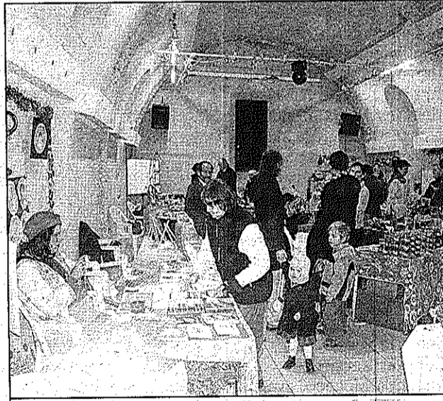
Un marché de Noël offrant mille créations de talent.

La neige sur les sommets, un ciel d'hiver bleu (ouf! la journée précédente était très froide et très venteuse)...Le décor était parfait pour l'arrivée du Père Noël. Descendant la route haute du village, à bord de sa carriole tirée par un poney, il était attendu des enfants qui, les yeux pétillants de magie, ont reçu friandises et oreilles attentives pour – en direct – passer leur commande! Pen-