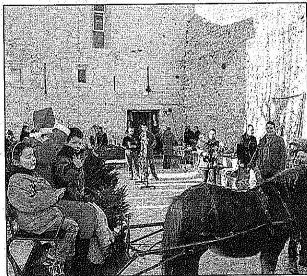
Le père Noël, en visite au village, a ravi les enfants.