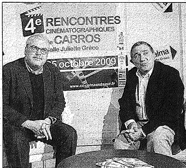
Les réalisateurs Roberto Ando et Beppe Cino, deux maîtres du cinéma sicilien à la rencontre du public français.

FESTIVAL La IVème édition a tenu toutes ses promesses avec des échanges fructueux, des découvertes, des coups de cœur et quelques émotions pures